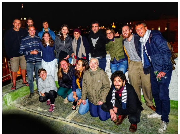
Lustige Runde zu Silvester

Katharinenkirche, die direkt an die orthodoxe Geburtskirche angrenzt und mussten unsere Eintrittskarte vorzeigen. Ohne die hat man am Heiligabend keine Chance, da der Ansturm einfach zu riesig wäre. Der Gottesdienst ging um Mitternacht los und war sehr traditionell großteils auf Latein. Über 100 Priester schichteten sich im Altarraum und die Kameraübertragung wurde live in der ganzen Welt ausgestrahlt. Spätestens, als wir aus voller Seele singen konnten, war dann doch Weihnachten angekommen. Rückzu verzichtete ich auf den Chor-Bus und wartete mit zwei anderen Mitvolontären, die auch im