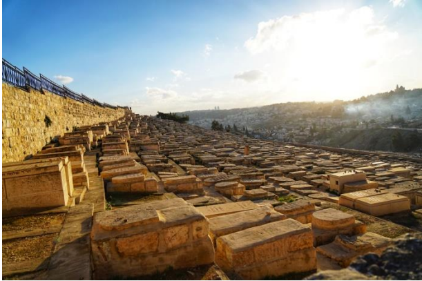
jüdischer Friedhof auf dem Ölberg

Mitvolontäre, denn zusammen lachen wir viel und nehmen fast alles mit Humor. Mit dem Wissen, dass viele Patienten zum Sterben ins Krankenhaus kommen, versuche ich beim Beziehungsaufbau mit den Patienten auf Distanz zu bleiben. Wenn es dann so weit ist, stirbt der Patient meist nicht plötzlich, der Tod bahnt sich an und man kann sich darauf einstellen. Die Sauerstoffmaske ist ein sehr eindeutiger Indikator und der Zustand der Patienten verschlechtert sich innerhalb weniger Tage drastisch. Manchmal kommt es aber auch vor, dass sich ein Patient von einer auf die nächste Runde