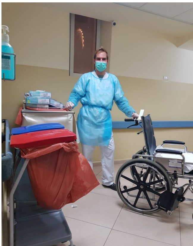
Auf Station mit Isolationskittel und Mundschutz

Auf C-Side sieht alles wieder etwas anders aus. Der Altersdurchschnitt ist geringer, die Patienten sind merklich leichter und man kann mehr mit den Menschen interagieren. Dort ist unsere sogenannte Onkologie, die Krebsstation. Sie bietet Patienten in aktiver Behandlung, also mit externer Chemotherapie, und palliativer Behandlung Raum. Palliative Behandlung verfolgt das Ziel, das Leben austerapiierter Patienten so angenehm wie möglich zu gestalten. Hier ist für die meisten Patienten Endstation, was von uns eine besondere Sensibilität erfordert. Depressionen und Schmerzen gehören zum Alltag, es geht um die Akzeptanz des Todes. Dazu kommt, dass Krebs und seine Folgen eine ungewollte Todesursache sind. Wer will schon gesagt bekommen, unheilbar und austerapiert zu sein? Die Patienten merken, dass auf einmal nicht mehr alles so geht, wie früher, was eine psychologische Abwehr in Gang setzt. Zuerst leugnen viele die Erkrankung, dann ringen sie mit ihr und zum Schluss akzeptieren sie sie im besten Fall.