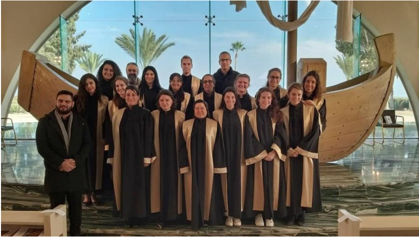
Mein Chor bei einem Auftritt in der St. Magdalenenkirche am See Genezareth

Eine sehr skurrile Angelegenheit und ganz anders, als ich es erwartet habe. Den Nachmittag verbrachte ich mit einigen anderen Volontären meiner Organisation im Paulushaus (andere Einsatzstelle) und wir spielten in weihnachtlicher Atmosphäre ein Spiel. Um 20 Uhr startete der Chor-Bus vom Notre-Dame Hotel neben unserem Krankenhaus Richtung