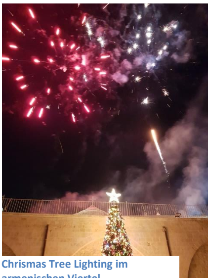
Christmas Tree Lighting im armenischen Viertel