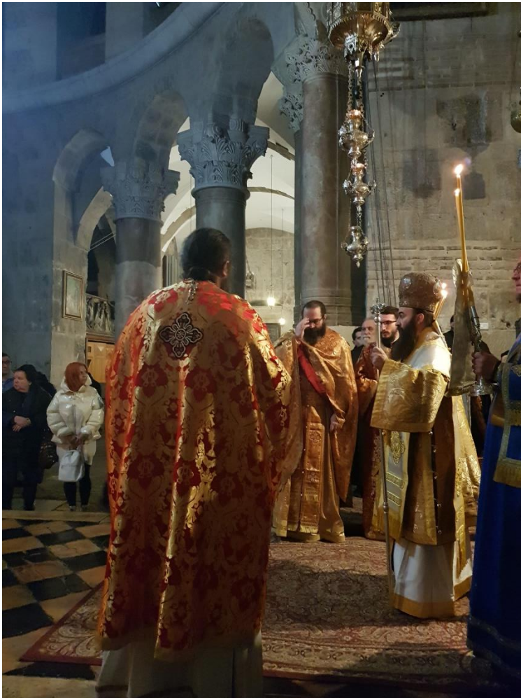
griechisch-orthodoxe Tauffeier Jesu am 6. Januar