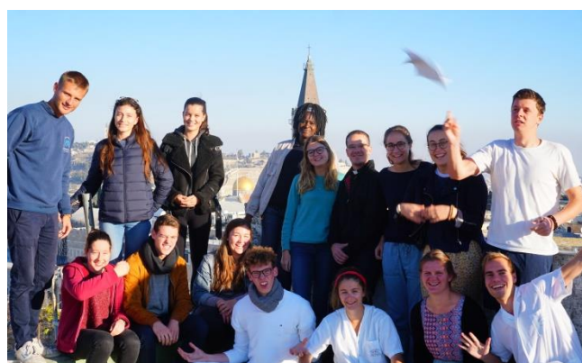
die French-Volunteers nach der Frühschicht auf dem Dach

Jetzt fragt sich vielleicht der ein oder andere, wie ich damit klarkomme. Ehrlich gesagt fällt es mir durch die vielen Ausgleichsmöglichkeiten gar nicht schwer. Zum Glück wurde ich zudem durch meine Organisation mental gut vorbereitet. Schon im Vorbereitungsseminar konnten wir in einem Spiel üben, uns gegenseitig zu füttern. Außerdem besuchten wir ein Hospiz und konnten ein interessantes Gespräch mit einer Mitarbeiterin führen. Dazu gesellen sich zahlreiche „Teachings“, die während meiner Anfangszeit eine Menge Zusatzinformationen stellten. Unersetzbar sind meine